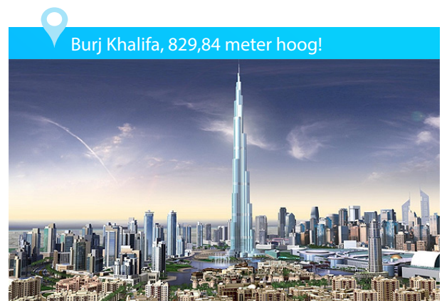
Burj Khalifa, 829,84 meter hoog!